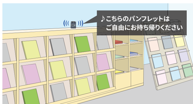
カタログ置き場のメッセージ