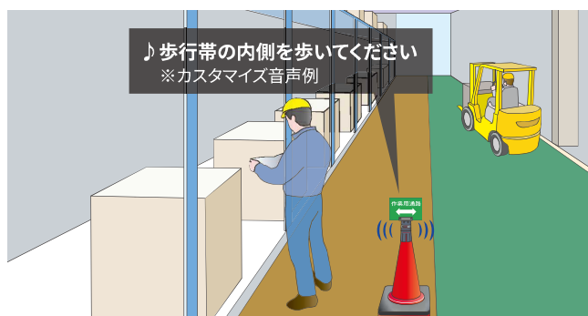
人車分離の安全対策(オプションのコーンアタッチメントとサインPOPを使用)