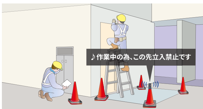
作業現場の注意喚起(オプションのコーンアタッチメントを使用)